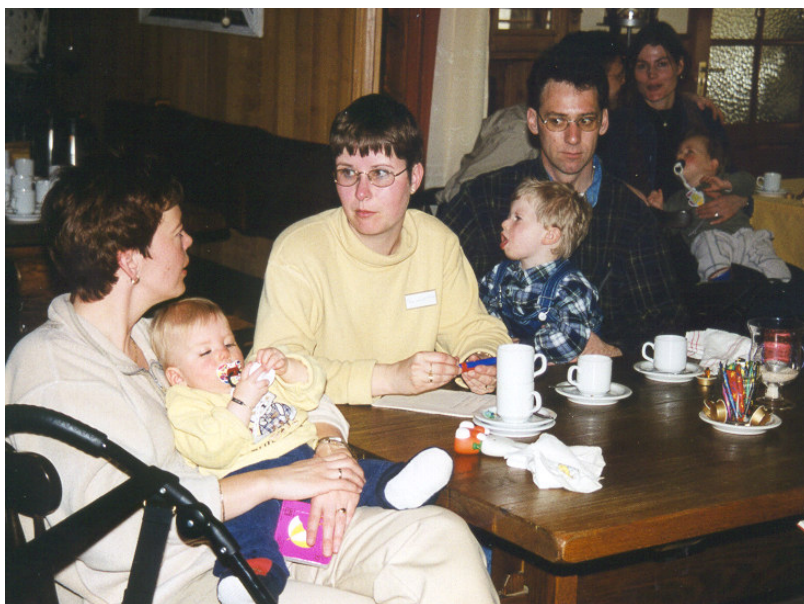
Contacten leggen, en ervaringen uitwisselen